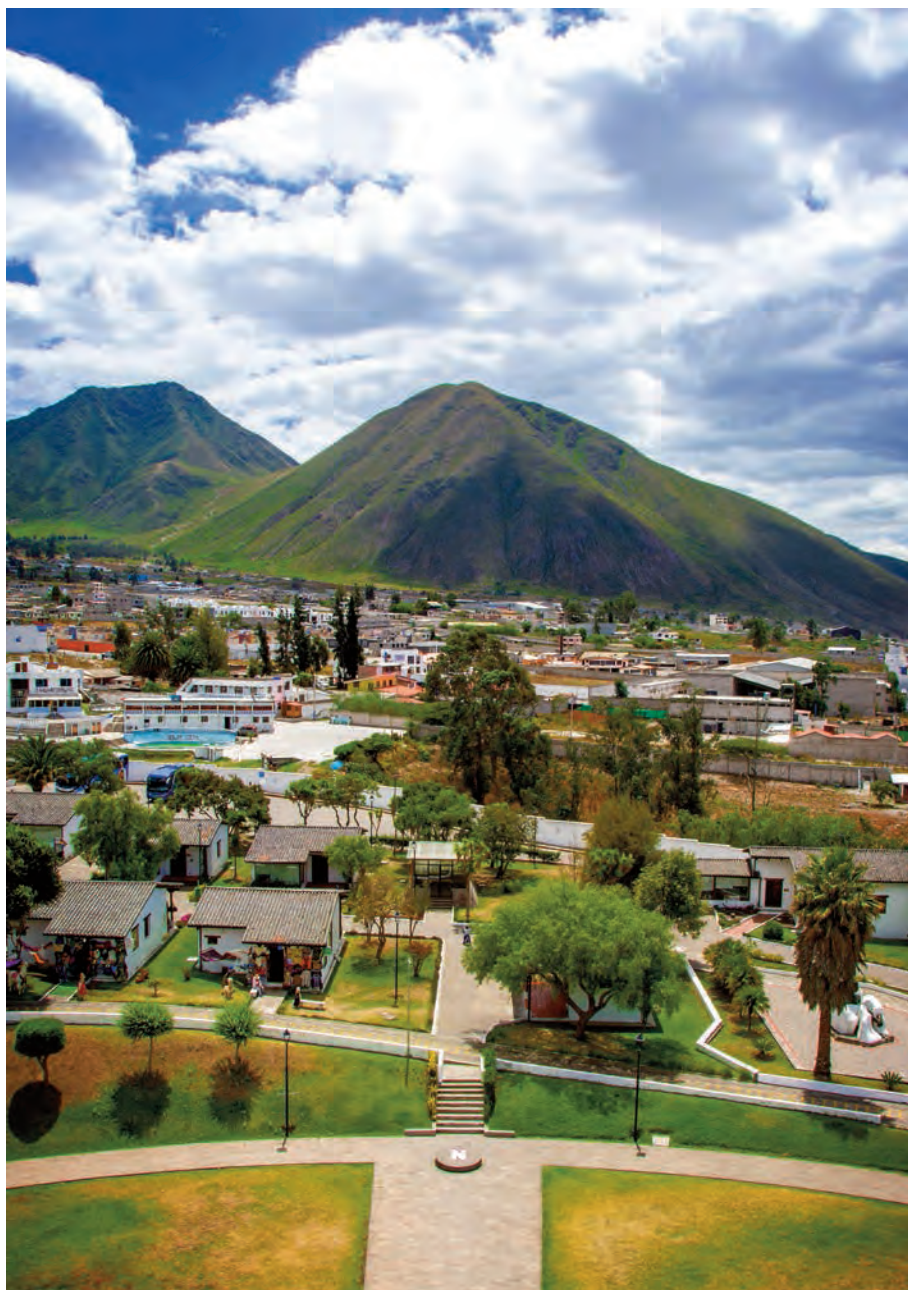
Cerro La Marca