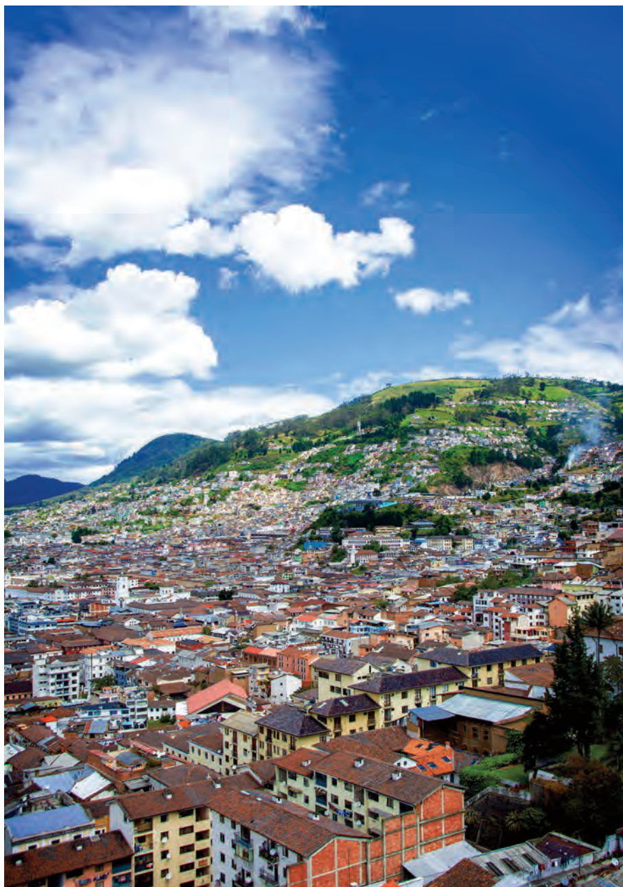
Cima de La Libertad