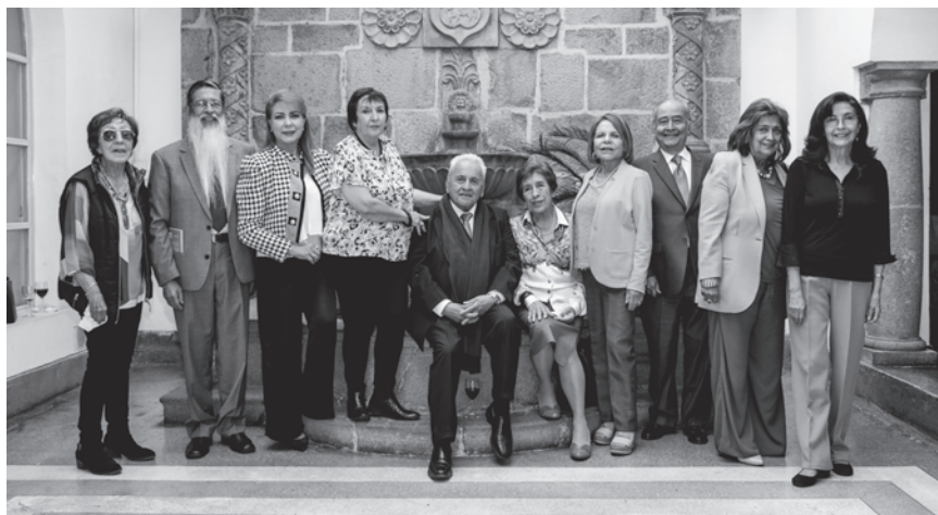
Presentación del libro 24 de Mayo de 1822. Horizonte histórico-cultural. (20 de mayo de 2023)