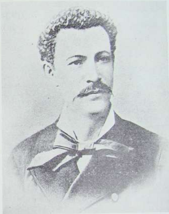
DON JUAN MONTALVO