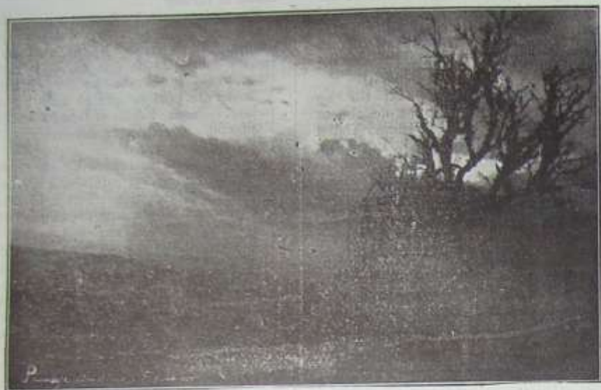
Una Cima de los Andes Ecuatorianos

to. Pero algo le detuvo. No un miedo ni un recelo. Un garfio desconocido que se le alerraba al alma como un anzuelo y que hacia presa dolorosamente. Qué era ese grillete impertuno?