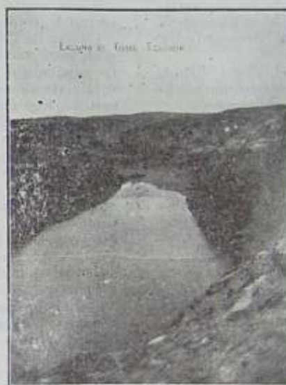
Laguna de Yambo