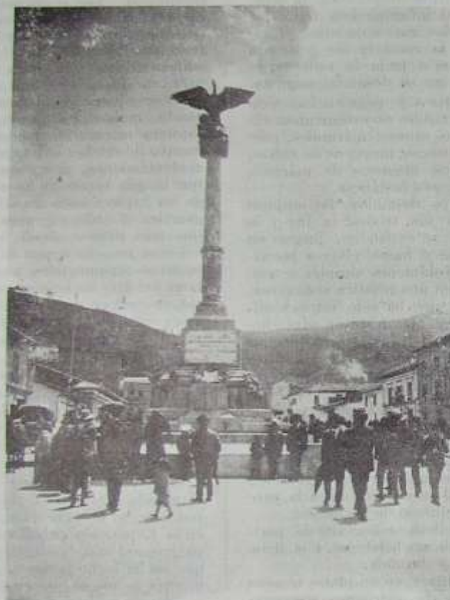
Monumento a los Héroes Ignotos, erigido en la Avenida "24 de Mayo".—Quito.

La Checoslovaquia nos presentó su arte rudo, en rojo y oro. Los revestimientos bermejos de los muros eran curiosos; las formas, usadas; las masas, firmes. Una estatua dorada se erguía ante la puerta del edificio, y era como un símbolo de un pueblo fuerte, todo voluntad y ansia de vivir.—(Concluirá).